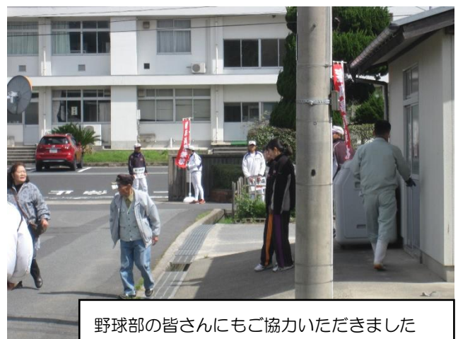
野球部の皆さんにもご協力いただきました