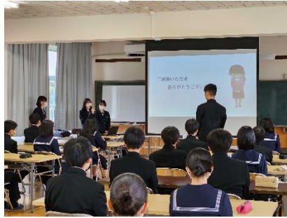
大田西中学校の生徒の方の質問