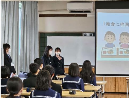
メニュー開発の研究発表

今回のメニュー開発にあたり、ご協力いただいた大田給食センターの皆様、そして、試食や感想・ご意見をいただいた大田西中学校の皆様、ありがとうございました。