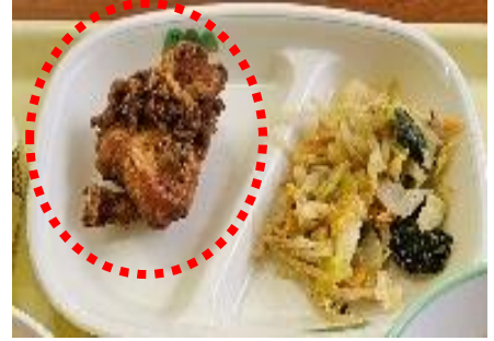
メニュー化された「ジーパイ」