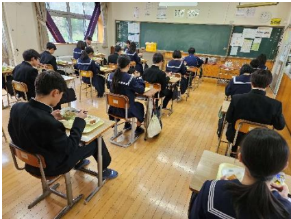
大田西中学校で試食会