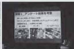
逋摩高校学習成果発表会