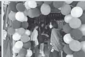
2年生クラス企画 ～お化け屋敷～