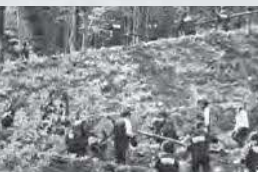
2年生石見銀山保全活動