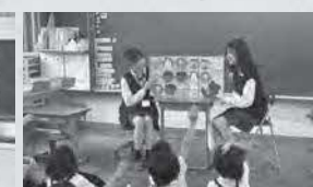
読み聞かせボランティア