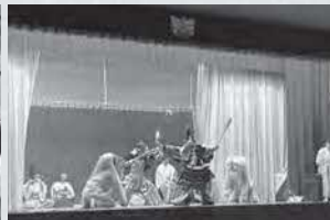
石見神楽部の公演