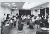
鳥根県総合学科交流会