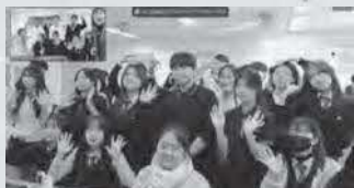
3年生韓国語 ～韓国高校生とのオンライン交流～