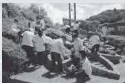
1年生花時計の植え替え