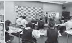
3年生アクアス実習