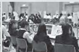
2年生進路ガイダンス