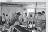
地域農業現地研修