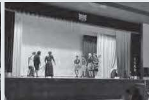
1年生ステージ企画 ～桃太郎～