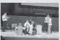
福祉技術コンテスト