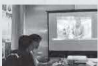
第1回金銀銅サミットオンライン開催